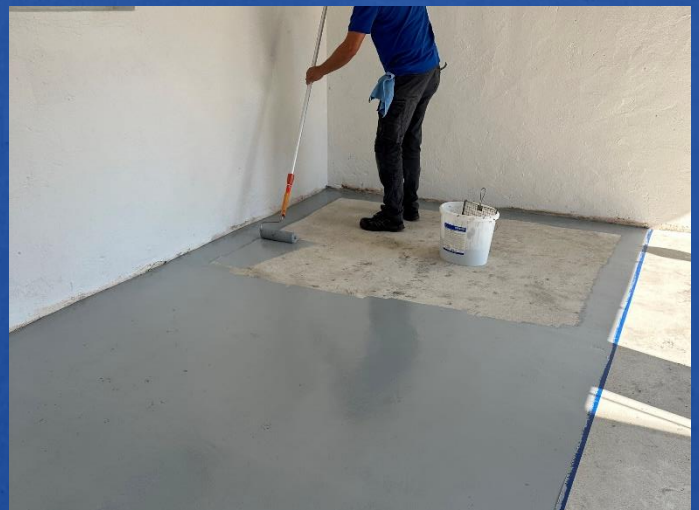
Für ein gleichmäßiges Erscheinungsbild im Kreuzgang aufrollen