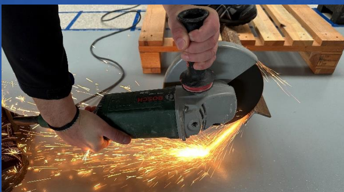
Schneiden von Metall auf OBTEGO® Concrete Coat Si

Selbst bei extrem heißen Temperaturen kommt es bei OBTEGO® Concrete Coat Si maximal zu Abplatzungen jedoch nicht zur Entzündung und Verbrennung wie es bei herkömmlichen Polymerbeschichtungen der Fall ist.