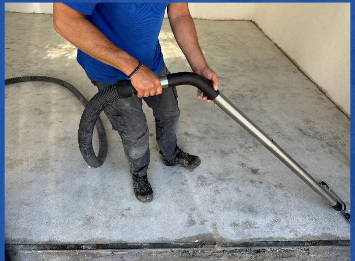
Absaugen mit Staubsauger