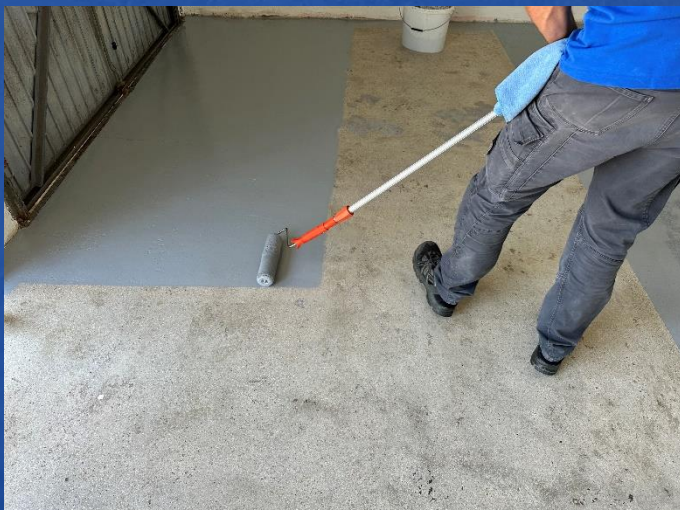
Aufrühren und zweimal mit kurzflorigem Mikrofaserroller aufbringen